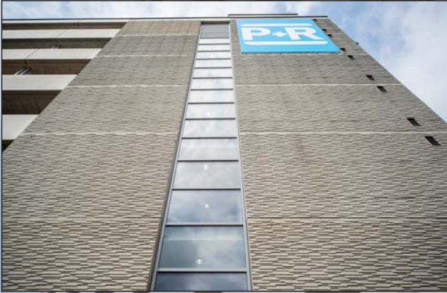
Fassadengestaltung mit der NOEplast Struktur Zagreb am APCOA Parkhaus Perfektastraße, Wien, Österreich