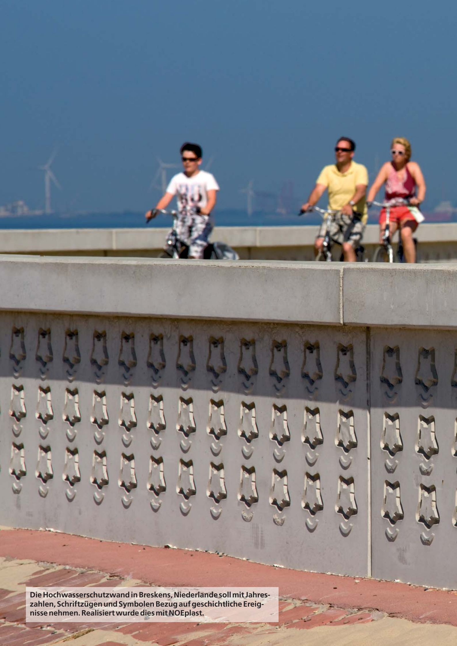
Die Hochwasserschutzwand in Breskens, Niederlande soll mit Jahreszahlen, Schriftzügen und Symbolen Bezug auf geschichtliche Ereignisse nehmen. Realisiert wurde dies mit NOEplast.