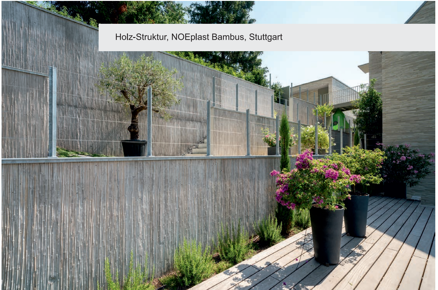
Holz-Struktur, NOEplast Bambus, Stuttgart