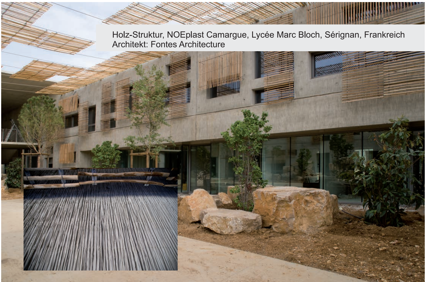
Holz-Struktur, NOEplast Camargue, Lycée Marc Bloch, Sérignan, Frankreich Architekt: Fontes Architecture