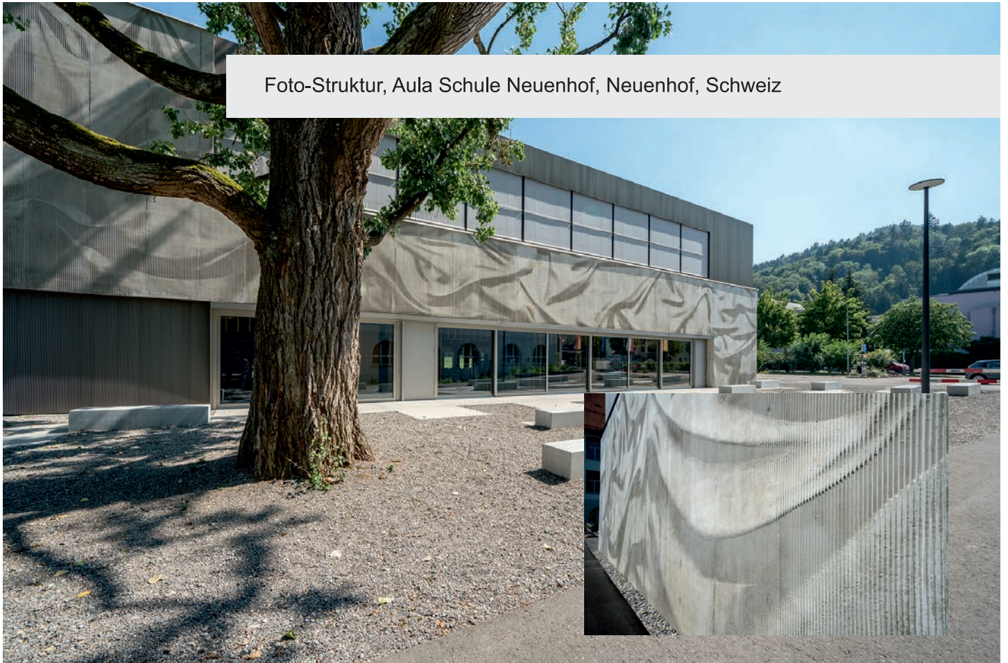
Foto-Struktur, Aula Schule Neuenhof, Neuenhof, Schweiz