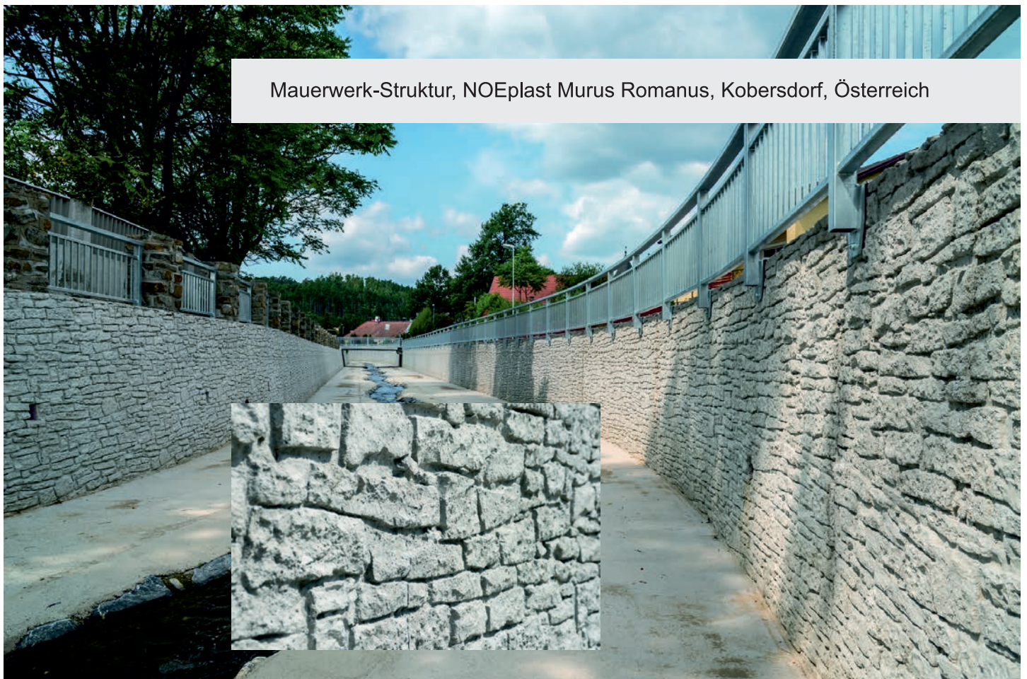
Mauerwerk-Struktur, NOEplast Murus Romanus, Kobersdorf, Österreich