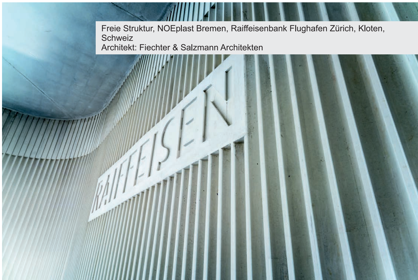
Freie Struktur, NOEplast Bremen, Raiffeisenbank Flughafen Zürich, Kloten, Schweiz Architekt: Fiechter & Salzmann Architekten