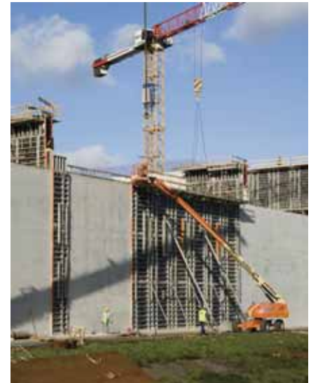
Die bis zu 13 m hohen Seitenwände wurden in einem Arbeitsschritt betoniert

Beim Bau der Rotterdamer Lagerhalle errichteten die Verantwortlichen im ersten Betonierabschnitt eine 13,00 m hohe Stellschalung, bauten die Bewehrung ein und ergänzten sie zunächst durch eine 6,00 m hohe Schließschalung. Diese wurde während des Betonierens um weitere 7,00 m aufgestockt. Durch diese Vorgehensweise war es möglich, die unteren Wandabschnitte gut zu verdichten. Da in der Halle loses Massengut gelagert werden soll, mussten die Planer auch dessen Druck auf die Wände berücksichtigen. Infolgedessen nimmt die Wandstärke nach oben