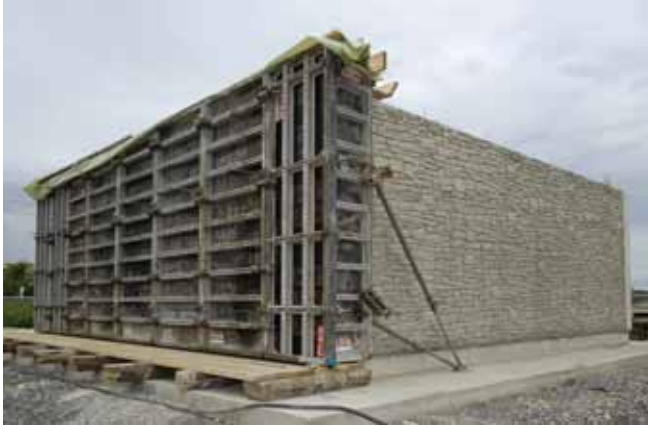
Die NOE Systemkomponenten (Matrize und Schalung) ergänzen sich hervorragend und stellen so ein optimales Ergebnis sicher