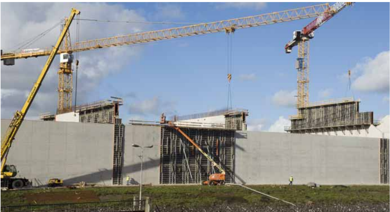
Abbildung unten: 65.000 m 3 beträgt das Speichervolumen des Massengutspeichers des European Bulk Services. Bei voller Befüllung sinkt er bis zu 5 cm in das Erdreich ein.

Abbildung links: Für die 18 m hohen Wände wurde auch die Arbeitsbühne NOE AB 300 eingesetzt