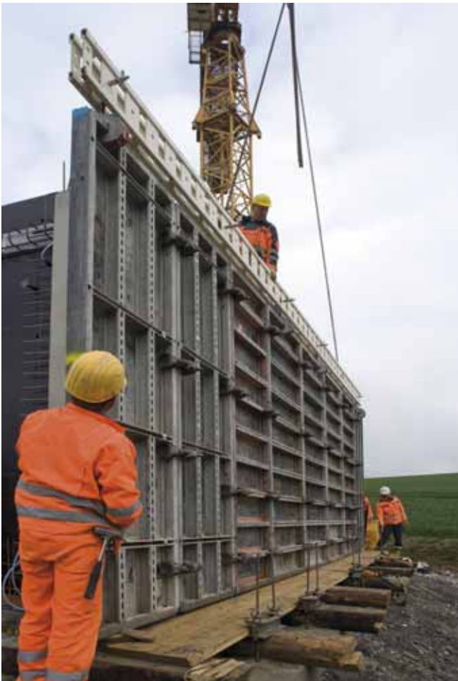
Ein NOEtec Träger erleichterte der Baustellen-Mannschaft das Ein- und Ausschalen

NOE-Schaltechnik ist der einzige Hersteller der Betonschalungen und Strukturmatrizen aus einer Hand anbietet. Deshalb kann NOE einen besonderen Service anbieten: Strukturmatrize und Schalung werden einsatzfertig auf die Baustelle geliefert. Das ist vor allem bei Ortbetonbaustellen eine wertvolle Hilfe, da hier häufig kein ebener, staubfreier Untergrund vorhanden ist und Temperaturschwankungen das Aufkleben der Matrize erschweren. Dies war eines der Argumente, warum sich die Arge-Mitarbeiter dafür entschieden, die Strukturmatrize von NOE auf eine Trägerplatte montieren zu lassen. Ein anderes war die geforderte Größe der Matrize. Das Motiv Murus Romanus hat eine Standardbreite von 6,00 m. Die Matrize selbst lässt sich jedoch in Länge wie Breite beliebig erweitern. Beim Betriebsgebäude Kulch musste die Matrize eine Breite von 8,20 m haben (also 2,20 m größer) und sollte keine Fuge aufweisen. Infolgedessen wurden die Matrizen in Höhe wie Breite so miteinander verzahnt, dass es wie ein durchgehendes Mauerwerk erscheint.