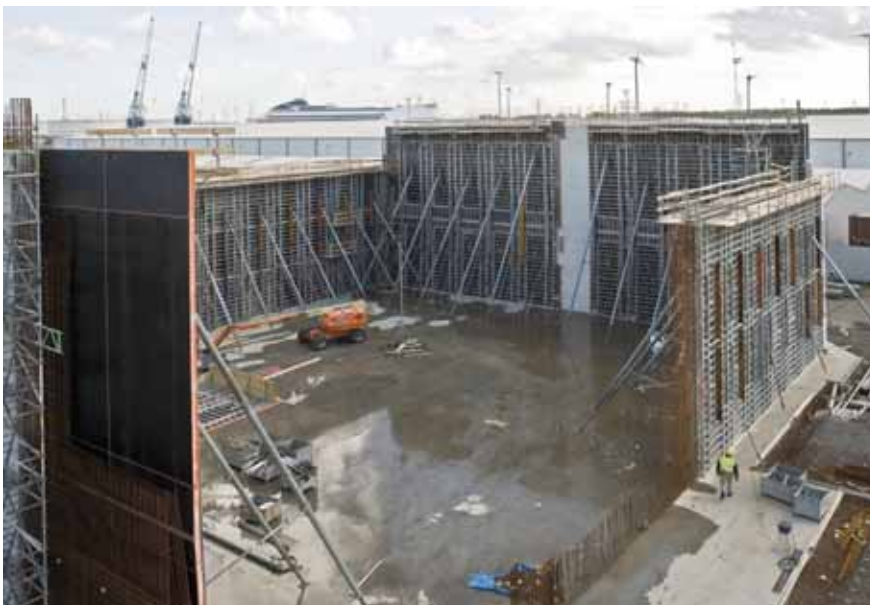
Die Stellschalung wurde gleich auf volle Höhe gestellt. Das Stellen der Schließschalung erfolgte in zwei Abschnitten

immer mehr ab. So beträgt diese unten einen Meter und oben nur noch einen halben. Die integrierte Gurtung der NOEtop Großflächentafeln machte es möglich, dass trotz konischer Wände horizontal verspannt werden konnte. Denn innerhalb der Gurtungen kann die Lage der Spann-