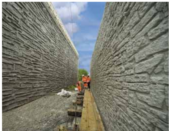
Eine ideale Kombination NOEtop Rahmenschalung und NOEplast Strukturmatrizen. Die NOEplast Strukturmatrize Murus Romanus wurde von NOE auf einer Trägerplatte vormontiert angeliefert.