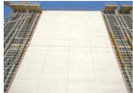
Überzeugend die Betonoberflächen

Abbildung links: Für die 18 m hohen Wände wurde auch die Arbeitsbühne NOE AB 300 eingesetzt