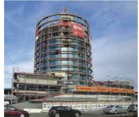
Ein optischer Hingucker mit dem Anspruch ein Wahrzeichen zu werden: der Turm der Erweiterung der Motorwelt Stuttgart

Die Architektur des Gebäudes zeichnet sich durch viele Schrägen und Neigungen der Wände aus. Hier konnten die NOE Techniker sich einen besonderen Vorteil der NOEtop zunutze machen: bei den Großflächen-Schaltafeln sind Gurtungen in die Schaltafeln integriert. So ließen sich schwere Schrägstützen, die für das Betonieren der Schrägen notwendig waren, direkt an den Schaltafeln befestigen, oh-